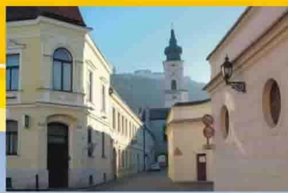
Marktgemeinde Furth bei Göttweig Untere Landstr. 17 Furth b. Göttweig