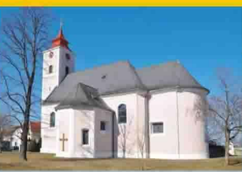
Marktgemeinde Michelhausen Tullner Straße 16 Michelhausen