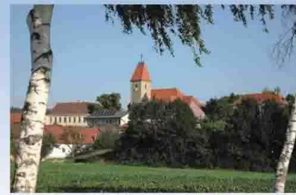
Marktgemeinde Weißenkirchen/Perschling Hauptstraße 21 Perschling