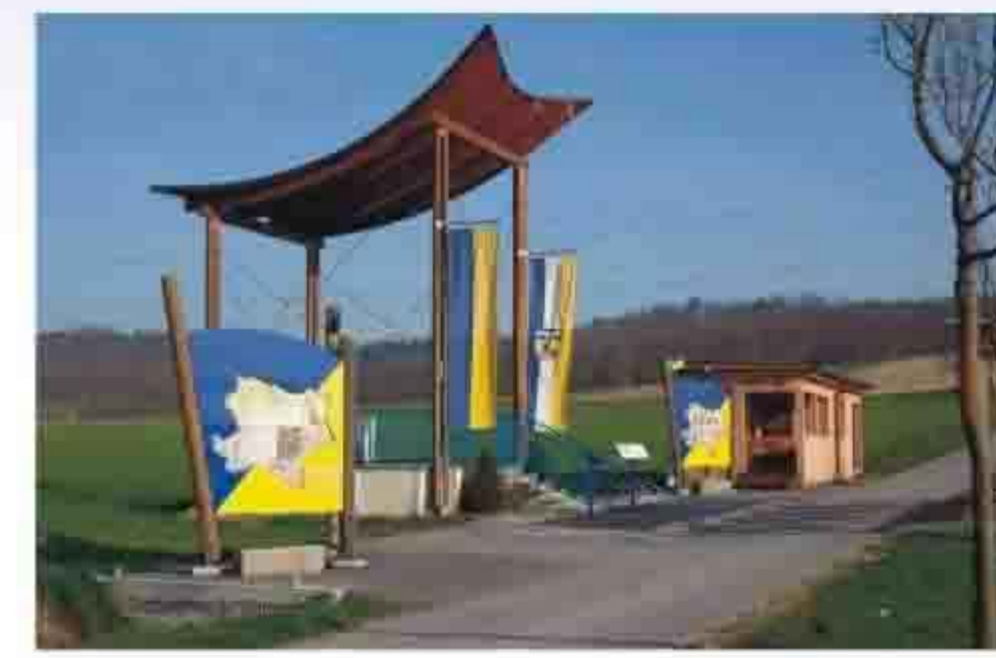
Marktgemeinde Kapelln Hauptstraße 13 Kapelln