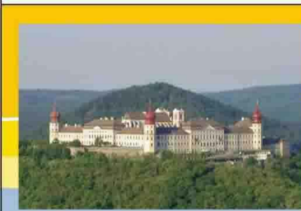
Benediktinerstift Göttweig A-3511 Stift Göttweig