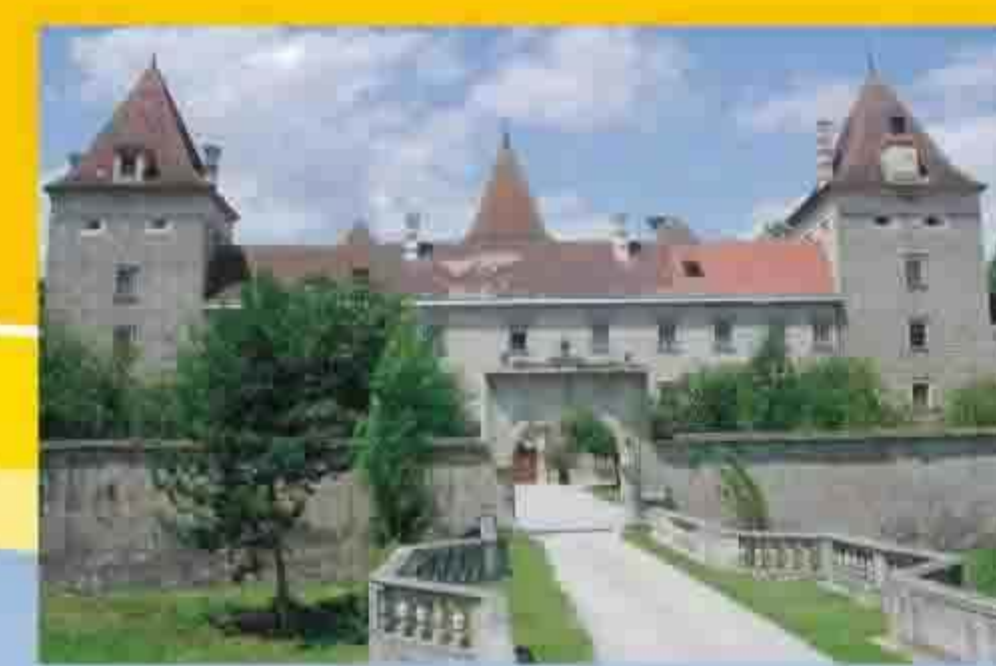
Gemeinde Inzersdorf-Getzersdorf Dorfstraße 20 Inzersdorf